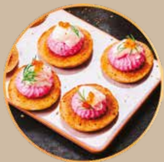
O Sole Mio