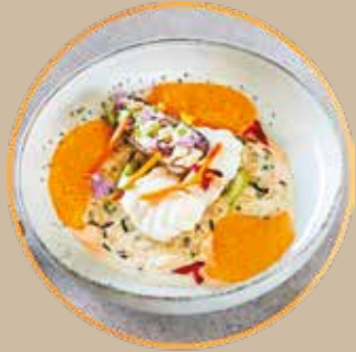
A Lotte of Risotto

française et tous ses acteurs, et en particulier les artisans poissonniers. Plus d'informations sur les réseaux sociaux Facebook (@PavillonFrance) et Instagram (@pavillon.france), ainsi que sur le site internet www.pavillonfrance.fr France Filière Pêche et l'OPEF ont le plaisir de vous offrir l'affiche PAVILLON FRANCE aux couleurs de la campagne « Fish&Chic », mettant en avant la recette de la sole au pamplemousse, idéale en période de fêtes.