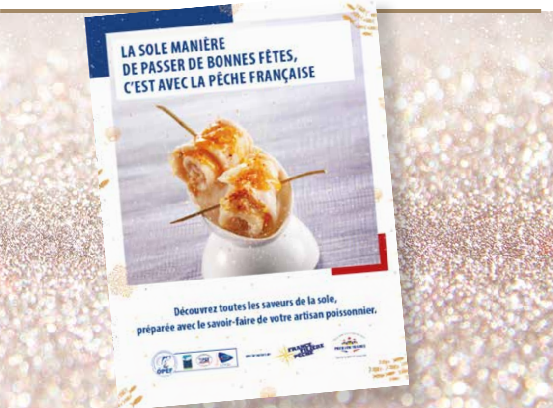
Affiche pour la boutique, offerte par l'OPEF et France Filière Pêche