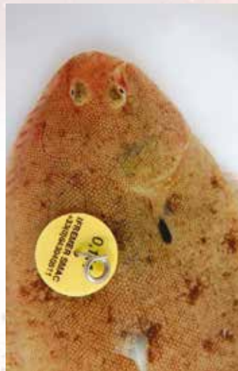
Marquage de sole

Le projet dans sa globalité a permis d'établir que le stock de soles en Manche Est (zone VIII) est en réalité constitué de plusieurs « sous stocks », ce qui peut s'avérer fondamental en matière de gestion des pêches.