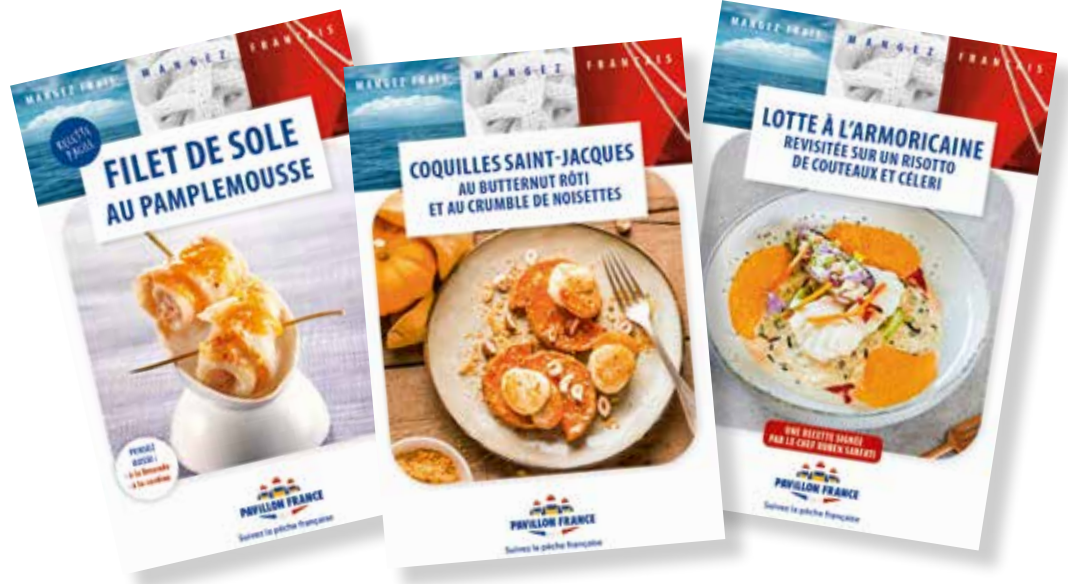
Fiches recettes de saison : Coquilles Saint Jacques, Lotte et Sole (réservé aux adhérents PAVILLON FRANCE)

retrouvez également les recettes de saison pour vos clients, et tous les outils à votre disposition en commande gratuite sur votre espace personnel : https://www.pavillonfrance-pro.fr/boutique/